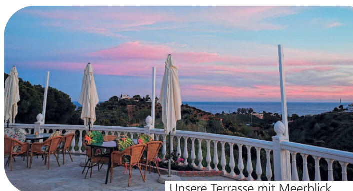
Unsere Terrasse mit Meerblick