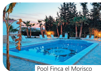
Pool Finca el Morisco