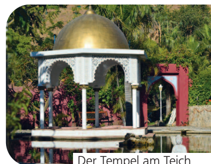
Der Tempel am Teich